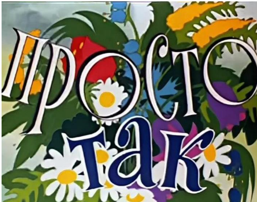
Кадры из мультфильма «Просто так», 1976 г.