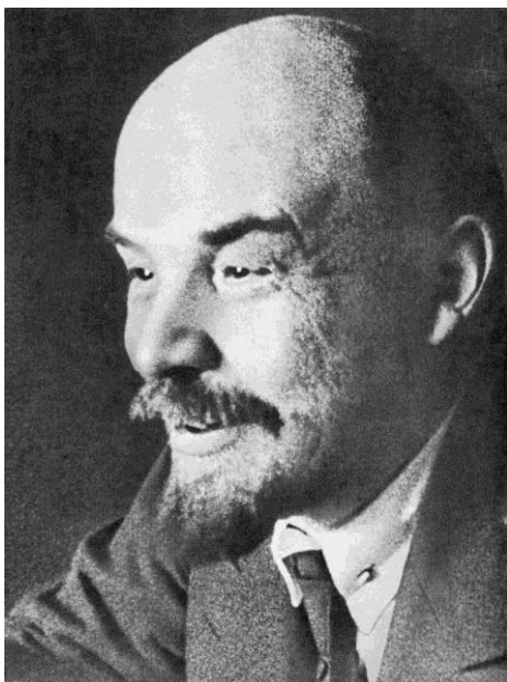
Владимир Ильич Ленин, 1920 г.