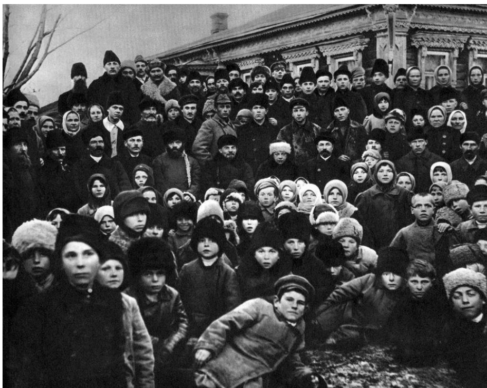
Ленин и крестьяне на празднике, посвященном открытию Кашинской электростанции. 14 ноября 1920 г.