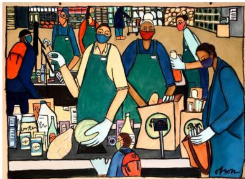
Carolyn Olson, Essential Workers, Pastel on paper