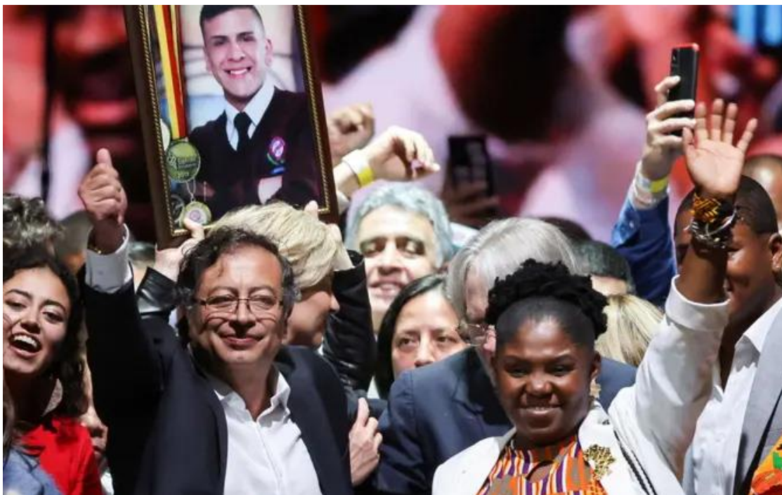
Густаво Петро победил на выборах президента Колумбии