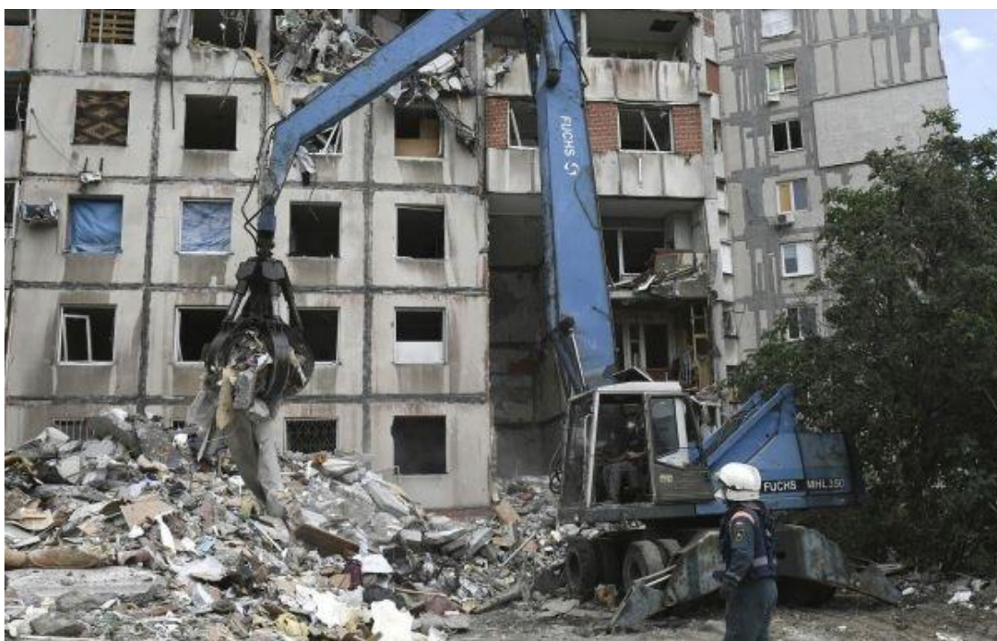
Мариуполь, 21 июня 2022 г.