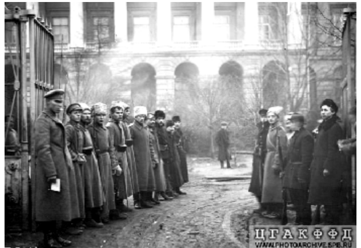
Смольный, февраль 1917 г.

Застрельщиками революции выступили 23 февраля петроградские работники - по случаю праздника борьбы 8 марта (по новому стилю). Общая ситуация была настолько накалена, что это выступление не осталось ограниченным всплеском, а стало детонатором уличного противостояния массы петроградских рабочих и властей города. Полиция не справлялась. Властям пришлось привлечь к подавлению «беспорядков» солдат петроградского гарнизона. Это намного повысило давление в котле, который и без того был