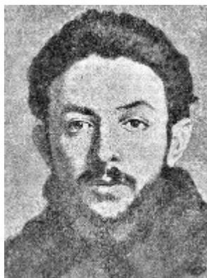
Евгений Левине, один из руководителей компартии Баварии. Расстрелян социал- демократическим правительством Гофмана 4 июля 1919 г.

мы и мюнхенский гарнизон свергли так называемое советское правительство и провозгласили советское правительство из коммунистов и революционных рабочих.