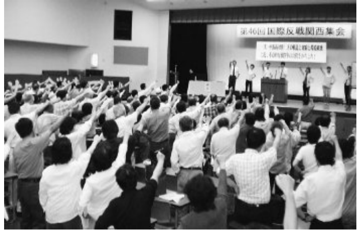
Собрание в Осака

Затем от имени трудящихся участников товарищ-учительница выступила против дислокации американского атомного авианосца «Д. Вашингтон» в Японии. Она гордо сообщила, что вместе с многими товарищами по профсоюзу и по службе активно проводит действия против дислокации