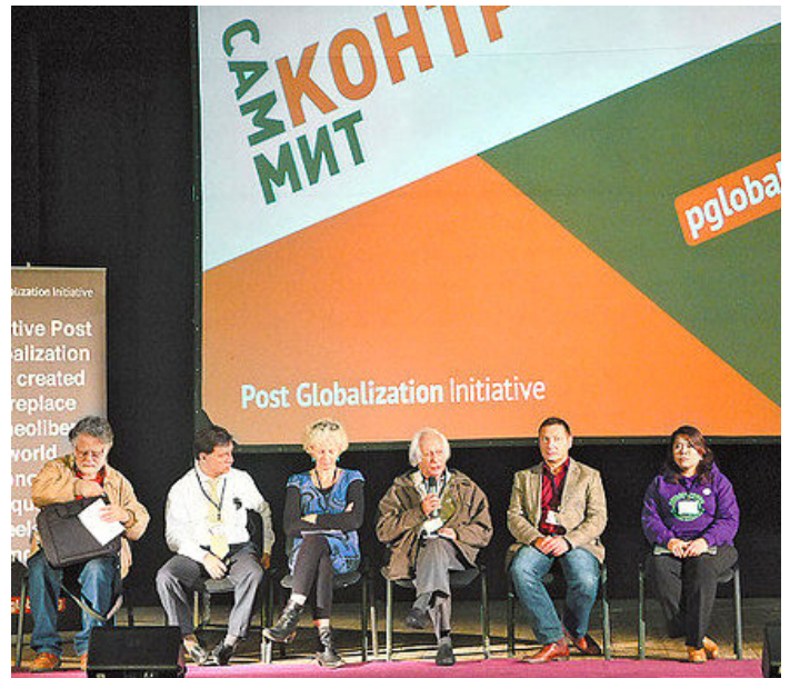
Выступает Самир Амин. Справа – Борис Кагарлицкий