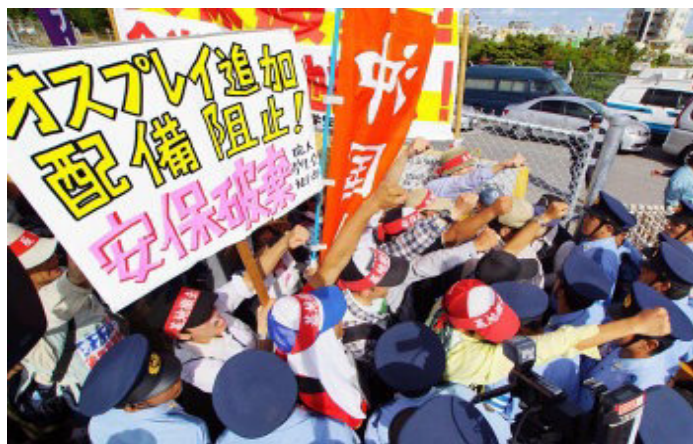
Блокировка ворот базы Футэнма

Над их головами Оспреи летели с грохотом на небольшой высоте в сто метров (попытка запугивания со стороны американских военных!) и приземлились на военной базе. Все участники акции подняли кулаки с восклицаниями горячих протестов. Действия протеста на Окинаве продолжаются и сейчас.