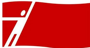
СОЦИАЛИСТИЧЕСКОЕ ДВИЖЕНИЕ КАЗАХСТАНА

Как желтые официальные, так и "розовые" якобы "демократические" профсоюзы, выступают за "социальный мир" и "социальное партнерство" с работодателями, пытаются внедрить, особенно в сознание новых молодых рабочих активистов и лидеров, идеологию соглашательства и отказа от активной и самостоятельной политической борьбы за свои права и интересы, от стремления к коренному переустройству общественного строя и задачи разрушения капитализма.