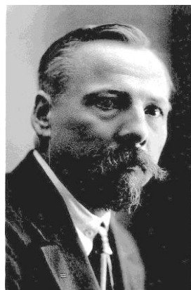
Председатель Временного революционного рабоче-крестьянского правительства Литвы В. Мицкович - Каисукас

Именем восставших рабочих и беднейших крестьян Литвы, именем красноармейцев Литвы объявляем власть германской военной оккупации, Литовской Тарибы и всех других буржуазных национальных советов и комитетов низложенной.