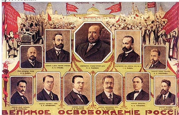
Первый состав Временного правительства Март 1917 г.

25 февраля 1917 г. массовые демонстрации под лозунгами «Хлеба!» и «Долой самодержавие» переросли во всеобщую политическую стачку. На другой день к ней стали присоединяться войска. 27 февраля Совет Министров послал царю в Ставку (Могилев) телеграмму с просьбой о коллективной отставке и разошелся. 28 февраля многие министры, включая Председателя Совета Министров были арестованы.