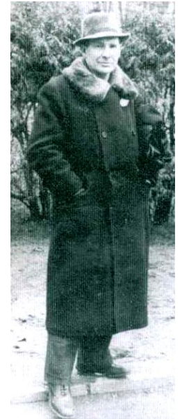
Жанис Липке. 1942-1944 гг.

Работая на складе, Липке добился от немецкого руководства, чтобы на работу разнорабочими были взяты молодые сильные еврейские парни из расположенного рядом гетто. Разработанная им схема спасения позволяла не только вывести евреев из гетто так, чтобы после работы никто не заметил факта их невозвращения, но и обеспечить их проживание в погребе до конца войны.