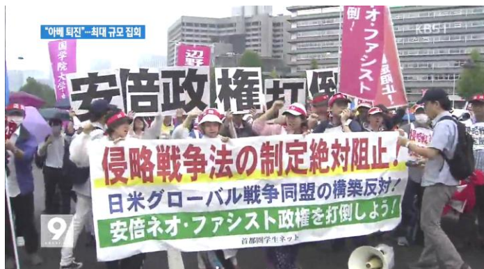
Борьба студентов против военных законов

Мы обвиняем также терроризм ИГИЛ, которое считает «иноверным» и убивает всех, кто не согласен с ним, без различия между правителями и трудящимися. Его свирепые действия противоречат освободительному делу рабочего класса. Ошибочность терроризма уже очевидна для всех марксистов. Тем не менее, не должно упускать из виду то, что ИГИЛ родилось на почве гнева и злобы мусульманских народов против империалистских властителей. Мы считаем, что в мусульманском мире гнев трудового народа проявляется в виде ИГИЛ в результате крайней слабости борьбы рабочего класса в странах империалистских и бывшего СССР. Именно поэтому, наша насущная задача — возродить мощную классовую борьбу пролетариата. Для этого нам надо восстановить подлинный марксизм как теоретическое оружие пролетариата и преодолеть идеологизацию, в которую рабочий класс во всем мире впал после развала называвшего себя «социалистическим» СССР.