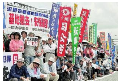
Студенты Дзэнгакурэн во главе митинга протеста перед воротами базы Кадена

Выступая в Хиросиме, Барак Обама не стал извиняться ни за преступления американской армии, ни за сброс атомных бомб. Его выступление не только японские СМИ, но и