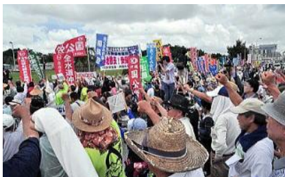
Протест на Окинаве 25 мая

Убийство девушки вызвало гнев и возмущение жителей Окинавы. Перед воротами базы собрались протестующие местные жители. «Пока здесь есть базы, это будет повторяться вновь и вновь! Очистить землю Окинавы от американских баз!».