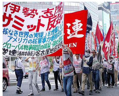
Демонстрация протеста в Нагоя 26 мая против саммита G7

На Окинаве трудящиеся, студенты и население ежедневно проводят решительные акции протеста против американских баз, начиная с «Кадены». Наши товарищи-работчие и студенты, выступают в первых рядах всех акций протеста. Окинава наполнена гневными голосами: «Блокировать все выходы с военных баз!» «Очистить землю Окинавы от американских баз!» «Препятствовать строительству новой базы в Хэно-ко!».