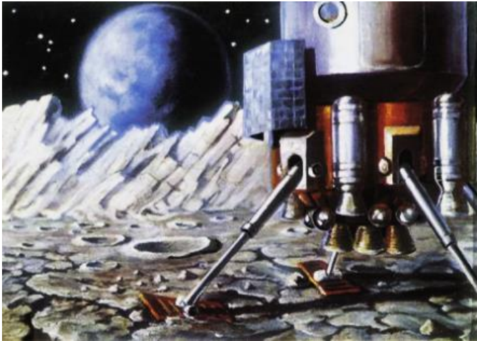
На Луне. Художники А. Леонов, А. Соколов, 1969.

Проблемы перехода от исследований Луны к её освоению разрешимы уже на нынешнем уровне развития технологий