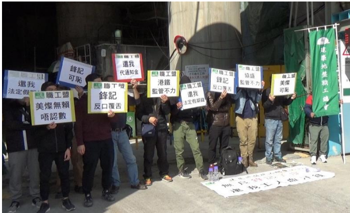
Невыплаты зарплаты – частое явление