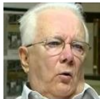
Армандо Харт Давалос 1930-2017