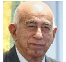
Хосе Рамон Мачадо Вентура 1930 г. рожд.