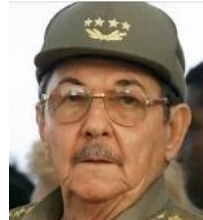
Рауль Кастро Рус 1931 г. рожд.

Фидель Кастро был великий оратор, способный в лучшие свои годы говорить часами, как, например, выступая в ООН, превосходный публицист. Не случайно, отойдя по возрасту и состоянию здоровья от активной партийной и государственной деятельности, он регулярно писал колонки в газету ЦК КПК "Гранма" – и это образцы политической журналистики, которые с интересом и удовольствием читаются, бьют в цель каждым тезисом, каждой фразой.