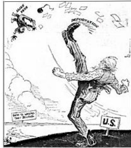
The Quicker and Harder, the Better."

Подпись: «Чем быстрее и жёстче, тем лучше!». Карикатура в американской прессе по поводу депортации в Россию